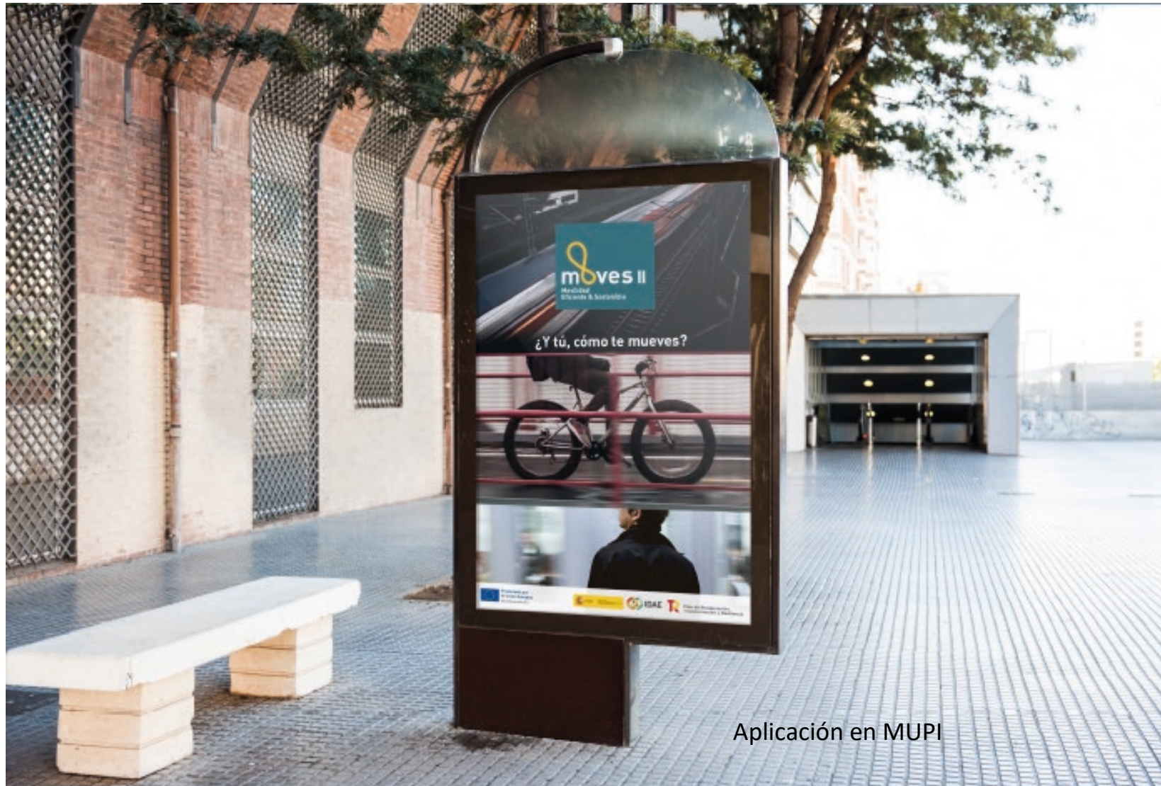
Aplicación en MUPI