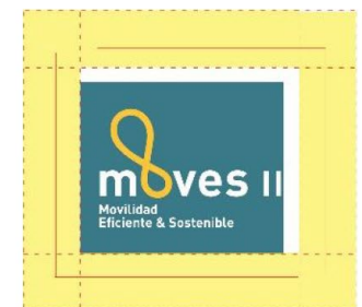
Invasión o reducción del área de seguridad